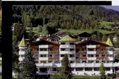
1. Una delle 18 buche par 69 del Golf Club Castelrotto - Alpe di Siusi. 2. L'Hotel Gardena di Ortisei incorniciata dalla rigogliosa natura delle Dolomiti. 3. Lo spazio benessere AquaSol all'interno dell'albergo.

Con le Dolomiti sullo sfondo e lo Sciliar a far da cornice unica ed esclusiva alle sue 18 buche par 69, il campo da golf Castelrotto - Alpe di Siusi amplifica il piacere di una partita di golf giocata sotto il cielo terso di questo magico angolo di Alto Adige. Divertente e competitivo anche per i giocatori più forti (da segnalare la buca 4, Hole in one, e la 15, un par 3, che presenta il dislivello più alto di tutta Europa), il percorso si snoda tra boschi millenari, laghetti e ruscelli che sgorgano dalle sorgenti ad alta quota a soli 21 chilometri da Bolzano, in una delle zone più belle della regione. A completare questo paesaggio da sogno, una piccola club house e un driving range con 32 postazioni scoperte. A rendere indimenticabile una vacanza in quest'area, il soggiorno nello splendido Relais & Châteaux Hotel Gardena di Ortisei, considerato una sorta di icona del lusso e dello charme della celebre località sciistica. Premiata dal Gambero Rosso come miglior albergo di montagna 2008, l'Hotel Gardena, oltre mettere a disposizione degli ospiti offerte esclusive che coniugano benessere e buona tavola (grazie anche alla presenza tra le sue mura del celebre Anna Stuben, ristorante con una stella Michelin), è convenzionato con il Golf Club Castelrotto - Alpe di Siusi e offre numerosi pacchetti golf e benessere.